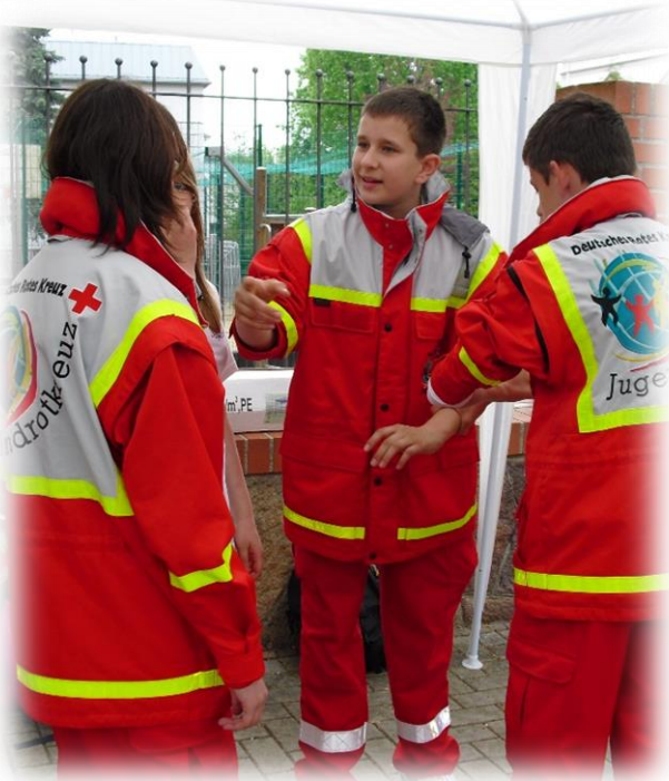
Teamkoordinator beim JRK-Wettbewerb in Döbeln 2010